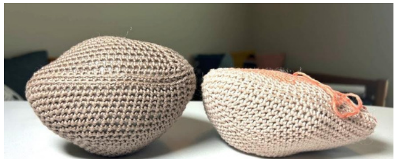
속을 충분히 채운 노커